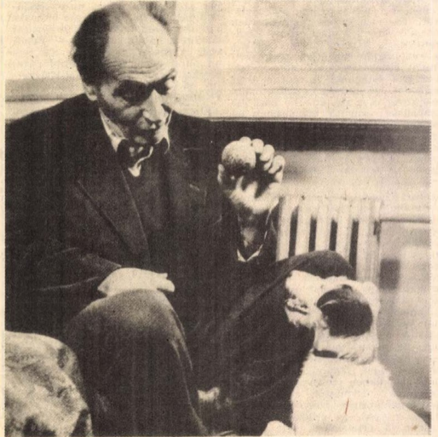
Újra otthon, kutyájával.